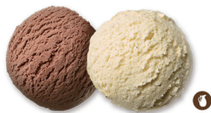
116. HELADO DOS BOLAS 5,00€