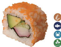
27. CALIFORNIA ROLL (Con aguacate, surimi, pepino, tobiko y alga nori) 6,00€