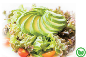
47. ENSALADA GOURMET CON AGUACATE 7,00€