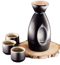
SAKE CALIENTE 7,00€