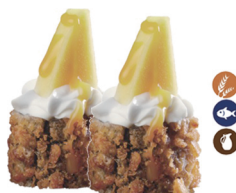
20. MANGOMAKI (Salmón, philadelphia, mango y salsa de mango) 5,00€