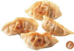
69. GYOZAS A LA PLANCHA (4UDS.) (Pollo y verduras) 5,50€