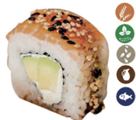
26. PHILADELPHIA ROLL (Roll de philadelphia con aguacate, cubierto de salmón, soja, alga nori y miel de sésamo) 6,00€