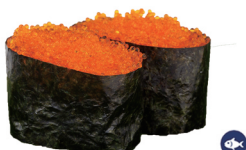
40. TOBIKO 6,00€/ 2uds.