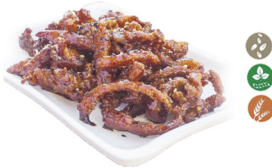
67. POLLO CAMELIZADO (Pollo caramelizado con soja.) 9,00€