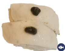
7. NIGIRI PEZ MANTEQUILLA FLAMBEADO 4,50€