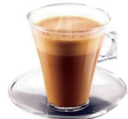
DESCAFEINADO CORTADO 2,00€