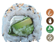
23. ROLL VERDURAS (Mixtas, philadelphia sésamo) 5,00€