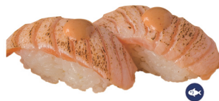
6. NIGIRI SALMÓN FLAMBEADO 4,50€