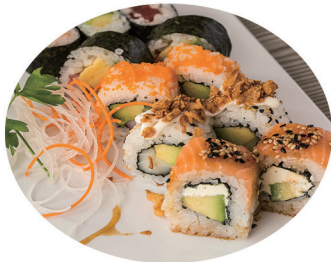
BANDEJA 1 (14 piezas)