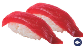
2. NIGIRI ATÚN 4,50€