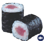
11. MAKI ATÚN 4,00€