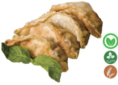
53. GOZAS FRITAS DE VERDURA (4 UDS.) 5,50€