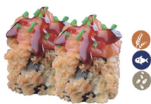
19. RHOT ROLL (Tartar de salmón philadelphia, surimi salsa teriyaki, sésamo, cebollín) 5,00€