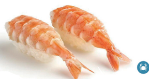
3. NIGIRI EBI 4,50€