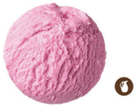
115. HELADO UNA BOLA (Choco, Vainilla, frambuesa, mango, sorbete limón) 2,50€