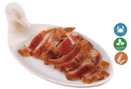
68. PATO ASADO (Pato asado) 9,50€