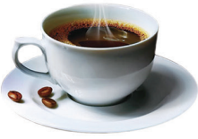
CAFÉ SOLO 2,00€