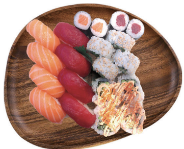
BANDEJA 3 (16 piezas)