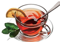
TÉ ROJO 2,20€