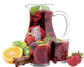
JARRA DE SANGRÍA 10,00€