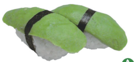
5. NIGIRI AGUACATE 4,00€