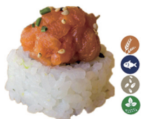
28. ROLL DE TARTAR DE SALMÓN (Roll de aguacate y salmón con salsa ponzu y sésamo) 6,00€