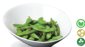
46. EDAMAMES 6,00€