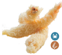
51. TEMPURA LANGOSTINO (3UDS.) 7,50€