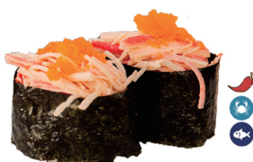
42. CANGREJO (Cangrejo, mayonesa picante y masago) 6,00€/ 2uds.