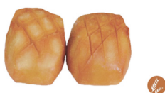
48. PAN CHINO 3,00€