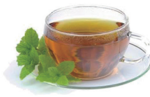
POLEO MENTA 2,20€