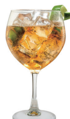
COPA DE LICOR ESPECIAL 5,00€