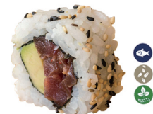
30. ROLL SPICY TUNA (Aguacate, atún kimuch) 6,50€