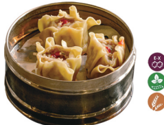
73. SHAO MAI CARNE (3 UDS.) 6,00€