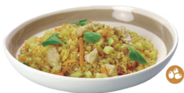
79. YAKIMEISHI CURRY TORI (Arroz con pollo, verduras salsa de curry y huevo) 8,00€