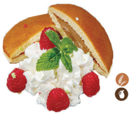
112. DORAYAKI CHOCO 6,00€