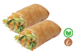
49. ROLLITOS VEGETALES (4UDS.) 5,00€