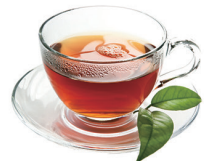
TÉ VERDE 2,20€