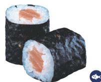
13. MAKI SALMÓN 3,50€