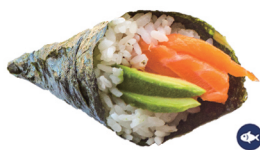
36. TEMAKI SALMÓN (Salmón y aguacate) 5,50€/ 1ud.