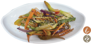
72. VERDURAS VARIADAS A LA PLANCHA 6,00€