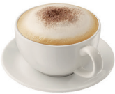
CAFÉ CAPPUCCINO 2,80€