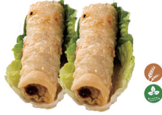
54. ROLLO DE POLLO (2 UDS.) (Crepes de arroz relleno de pollo y verduras ) 4,50€