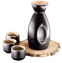
SAKE FRIO 7,00€