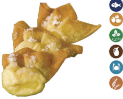
55. WANTUN DE QUESO (4 UDS.) (Crepes de harina de trigo rellenos de crema de queso y surimi) 5,50€