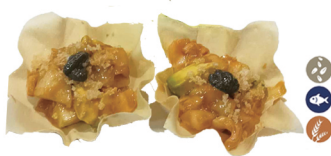
35. TACO DE PEZ MANTEQUILLA 6,00€/ 2uds.