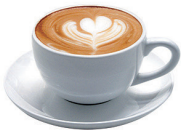
DESCAFEINADO CON LECHE 2,00€