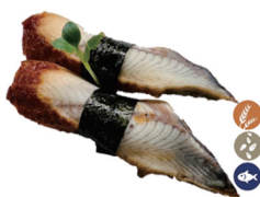
9. NIGIRI UNAGI (Anguila salsa teriyaki) 7,00€