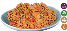
81. PAODAN MIAN TALLARINES (Paodan mian tallarines, con huevo, verduras y soja.) 6,00€