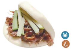
77. GUABAO PATO (Bao de pato) 7,00€/ 1ud.