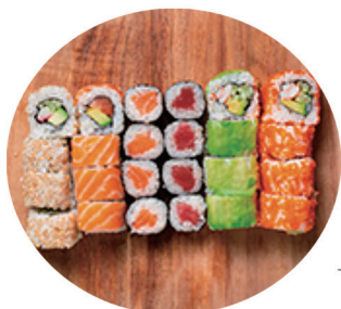
BANDEJA 5 (24 piezas)