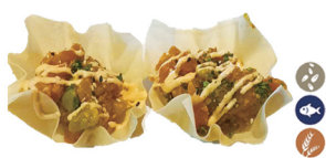
34. TACO DE SALMÓN 6,00€/ 2uds.