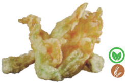
50. TEMPURA DE VERDURAS VARIADAS 6,50€