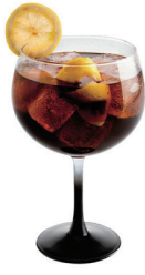
CUBATA COMBINADO ESPECIAL 8,50€