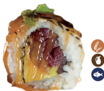
32. ROLL ATÚN GRATINADO (Aguacate, atún queso, y tobiko) 6,50€