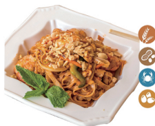
82. PAD THAI (Pad Thai, con pollo, langostinos, huevos, verduras, fideos de arroz y cacahuetes.) 8,00€