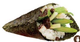
39. TEMAKI VEGETAL (Mixta pepino aguacate y trufa) 5,50€/ 1ud.