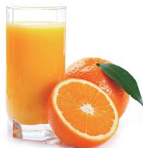
ZUMO NATURAL 3,60€