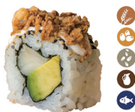
25. ROLL DE CEBOLLA FRITA (Pez mantequilla, aguacate mayonesa y cebolla frita) 6,00€