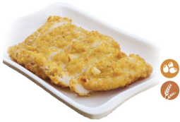
66. POLLO AL LIMÓN (Pollo con salsa de limón) 8,00€