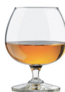
COPA DE LICOR 3,50€