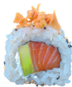
22. ROLL SALMÓN (Philadelphia, aguacate, cebolla frita y sésamo) 6,00€