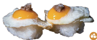
10. NIGIRI DE HUEVO DE CODORNIZ (Nigiri de huevo de codorniz con trufa) 5,00€