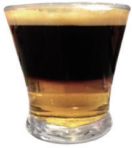
CAFÉ CARAJILLO 3,50€