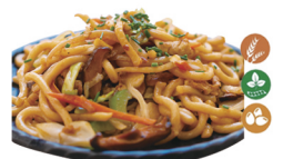
83. YAKI UDON (Con tallarines udon, setas, huevo, verduras, cebollino, soja y salsa tonkatsu.) 6,00€