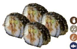
16. MAKI TEMPURIZADO (Maki frito en tempura relleno de salmón, escolar negro, aguacate, crema de queso y con salsa de anguila) 5,50€