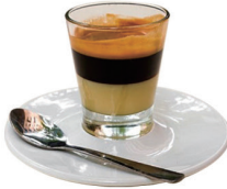
CAFÉ BOMBÓN 3,00€