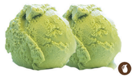
117. HELADO DOS BOLAS TÉ VERDE 5,50€