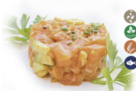
43. TARTAR DE SALMÓN (Con salmón, aguacate, cebollino y sésamo) 9,00€