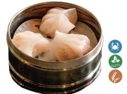
74. XIAO JAO GAMBAS (3 UDS.) 6,50€