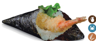
37. TEMAKI LANGOSTINO (Langostino en tempura ensalada, salsa rosa) 5,50€/ 1ud.