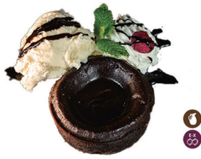
113. COULANT DE CHOCOLATE 6,00€