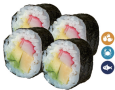
17. FUTOMAKI (Surimi, aguacate, huevo y pepino) 5,00€