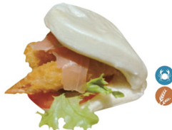
76. GUABAO GAMBAS (Bao de gambas) 7,00€/ 1ud.