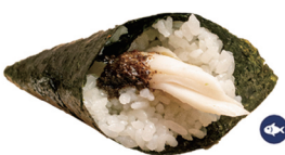
38. TEMAKI PEZ MANTEQUILLA (Pez mantequilla pepino, trufa) 5,50€/ 1ud.