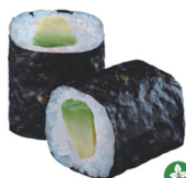
12. MAKI AGUACATE 3,50€