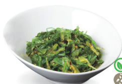
45. WAKAME 6,00€