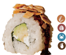
31. ROLL ALMENDRAS (Aguacate, queso y almendras) 6,00€