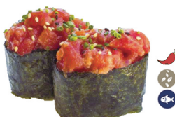
41. SPICY TUNA (Spicy tuna) 7,00€/ 2uds.