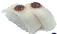
4. NIGIRI PEZ MANTEQUILLA (Flambeado con salsa trufa) 4,00€