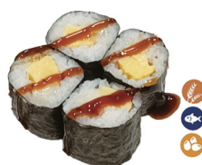
15. MAKI PEZ MANTEQUILLA CON TORTILLA HUEVO 3,50€