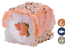
29. ROLL ABURI (Aguacate, salmón con salsa anguila) 6,00€