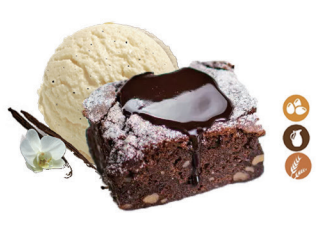
114. TARTA DE BROWNIE CON HELADO 6,00€