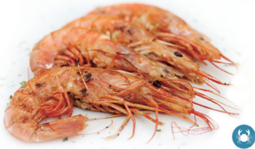
70. GAMBÓN A LA PLANCHA (4UDS.) 7,00€