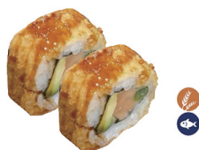
18. ROLL TEMPURIZADO (Tempura salmón y salsa teriyaki) 5,50€