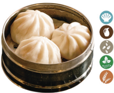
75. XIAO LONG BAO CARNE (3 UDS.) 6,00€