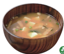
44. SOPA DE MISO 5,50€