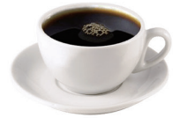
CAFÉ AMERICANO 2,00€