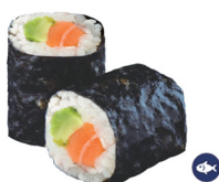
14. MAKI DE SALMÓN Y AGUACATE (Salmón y aguacate) 4,00€