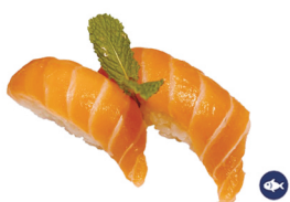
1. NIGIRI SALMÓN 4,00€