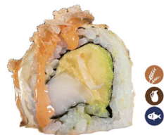
33. ROLL PEZ MANTEQUILLA GRATINADO (Aguacate, pez mantequilla queso, y tempura) 6,50€