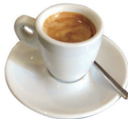
DESCAFEINADO SOLO 2,00€