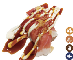
8. NIGIRI JAMÓN (Jamón y mayonesa) 4,50€